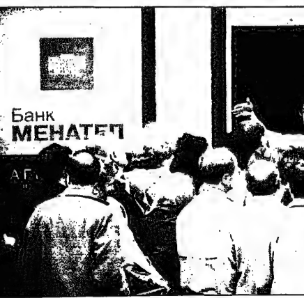
مؤتمر روسي يتباحثون أمام مصرف في موسكو السبت، والتميم (ويهزأ)

تشرنوميرديان سيركز على تسديد الأجور والمعاشات المتأخرة